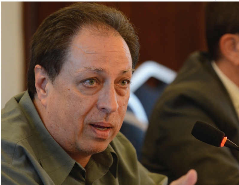
Μετά από εισήγηση του προϊσταμένου του Τμήματος Αμπέλου, Οίνου και Αλκοολούχων Ποτών, Διεύθυνση Γραμματικού , έρχεται η ρύθμιση για τις φυτεύσεις.